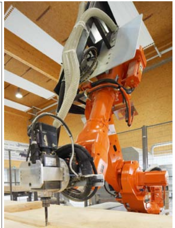
Vorzeigebeispiele des Holzclusters zum Thema Innovation und Technologietransfer: Die brandaktuelle Plattform BSP-Wiki vermittelt Brettsperrholz-Know-how zwischen Forschung und Unternehmen. Rechts: Die Hightech-Prototypen-Fertigung am ECW in Zeltweg.